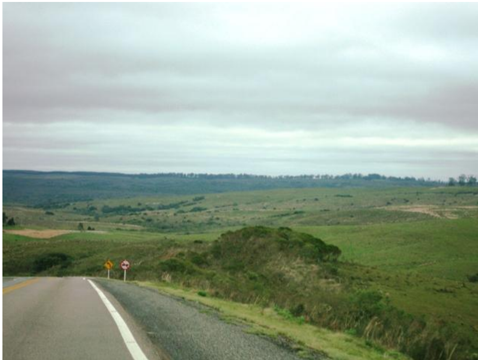
Dia de inverno na BR-153, em Bagé – agosto de 2011

A temperatura média anual é de 17°C e há uma distribuição regular das chuvas o ano todo, mesmo que ocorram, esporadicamente, alguns períodos de estiagem, influenciados por fenômenos meteorológicos.